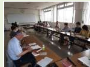
▲ 俳句ワールド 句会

■平成26年度は『まちの先生講座』も3年目となり、新たな企画、工夫を加え、発展させていく予定です。ご期待ください。