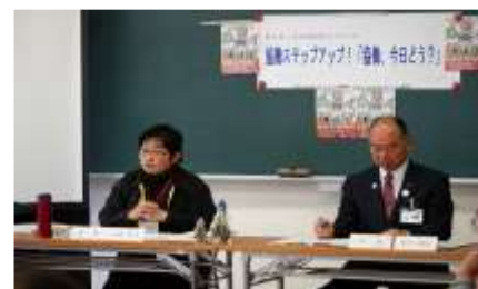
市長を招いて「協働ステップアップ～協働、今日どう？～」市民団体と意見を出し合います