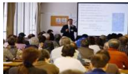
大盛況のエンディングノートの書き方セミナー

今回のフェスティバルも多くの市民の皆さんやご協賛いただいた方々のご協力、ご支援を得て無事に終えることができました。今後も「学ぶ」をキーワードに様々な形で続けられたら・・・と思います。