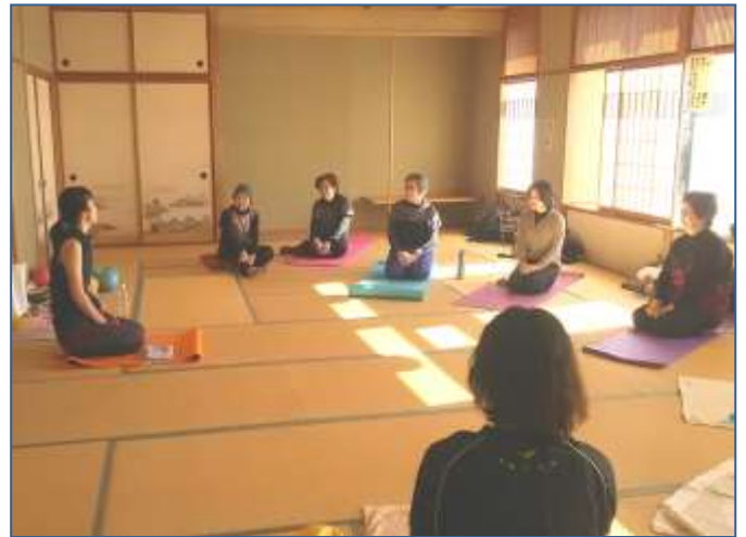
まちの先生講座「青竹&ボールで簡単ヨーガ」の様子

今年度の募集は終了しましたが、次年度も開催予定です。ご興味のある方は、上記のいるまなびとサイトをぜひご注目ください。