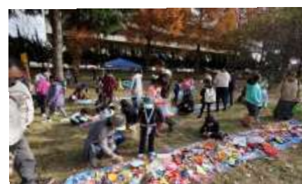
「子どもやんちゃ化計画」かえっこバザールなど彩の森入間公園で開催