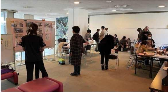
エレベーター前では まちの先生特別講座／血管年齢測定