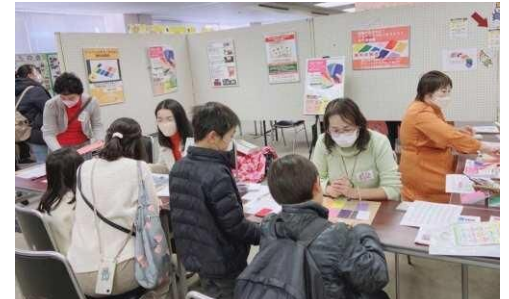
カラーセラピー体験