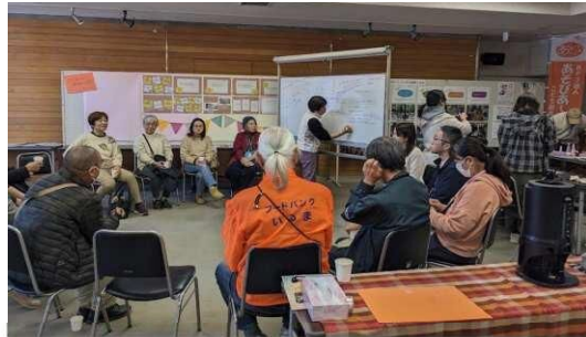
2023年10月10日に取り下げられた #埼玉県虐待禁止条例改正案について 11:00～12:30 ディスカッション