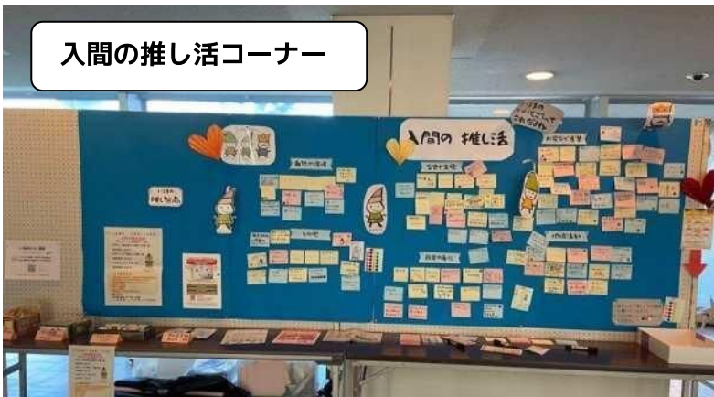
入間の推し活コーナー